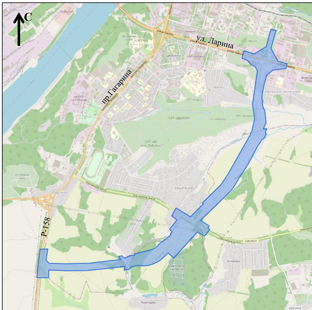
Схема границ подготовки проекта планировки территории (арх. № 115/23)

«ПРИЛОЖЕНИЕ к приказу министерства градостроительной деятельности и развития агломераций Нижегородской области от 4 мая 2022 г. № 06-01-02/49